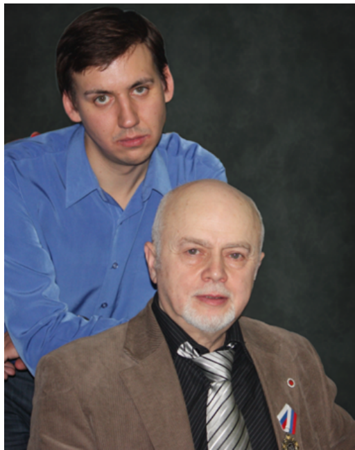
С любимым Учителем (2009 год)

Вл. Войнович «Жизнь и необычайные приключения солдата Ивана Чонкина». Фотокопия с издания YMCA-PRESS, Париж 1976. 138 л, нет 11 стр. Изготовил Шнабель в конце 1970-х гг. В специальной коробке.